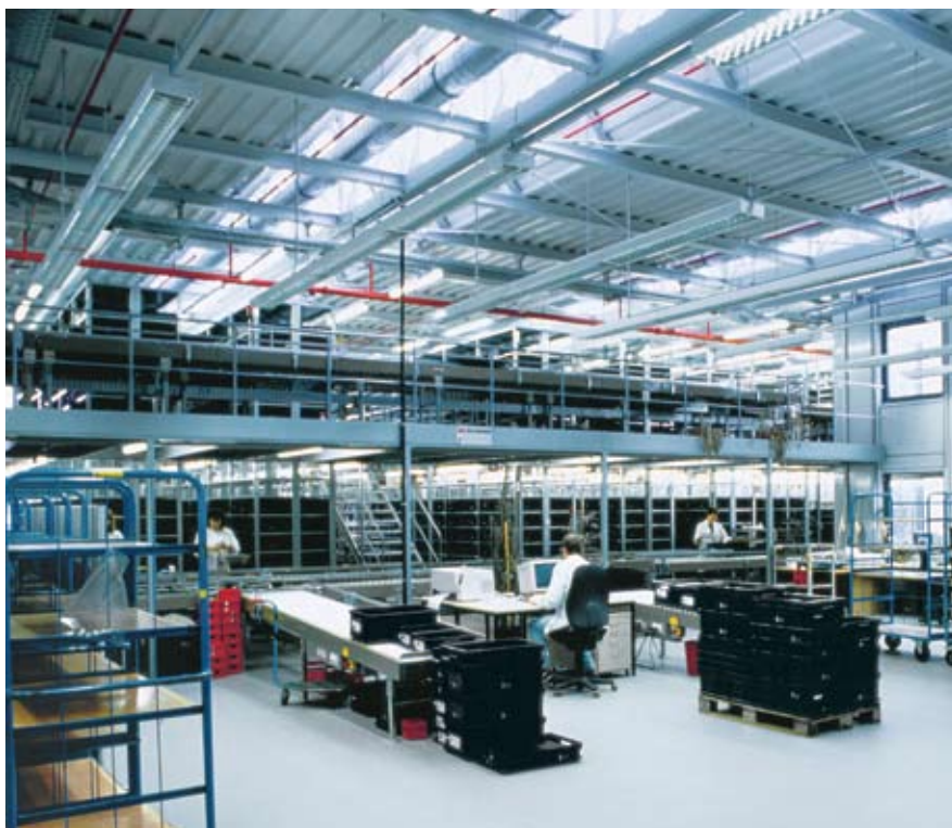
Hög driftsäkerhet, låga underhållskostnader och god arbetsmiljö. Med LUMILUX® 4Y® LONGLIFE är din anläggning säker.