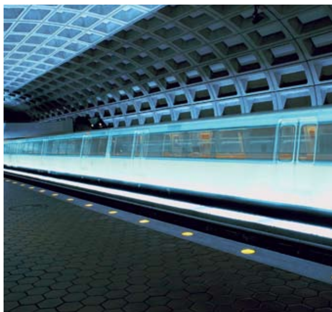
Besvärligt att byta? Planera gruppyten när det passar dig.