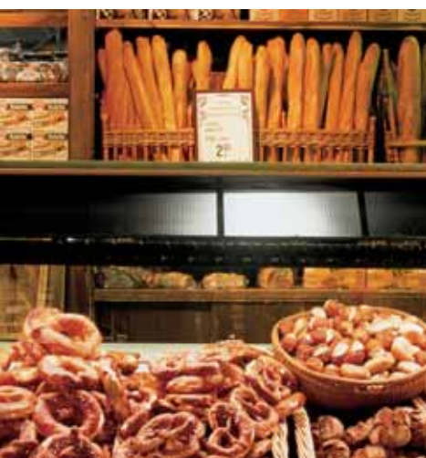
OSRAM NATURA®/OSRAM NATURA® SPLIT control lysrör i ljusfärg 76 – rätt ljuskälla för att få livsmedel att se riktigt aptitligt ut.

Lysrör med skyddshylsa måste bytas efter 10 000 timmars drift.